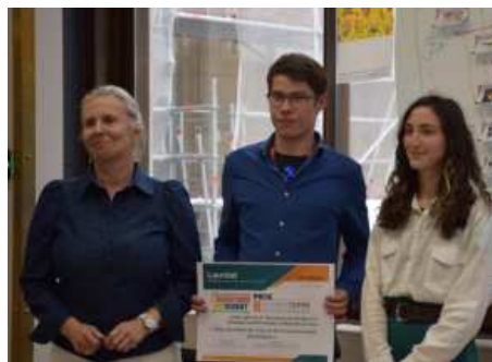
Lycée agricole Georges Desclaude de Saintes (17)