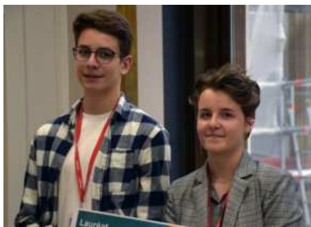
Collège Anne Frank de Brives-Charensac (43)

Le Prix 2023 a été attribué aux élèves et étudiants du :