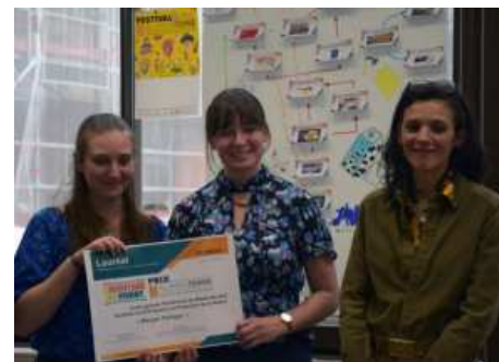
Lycée agricole de Pixérécourt Malzéville (54)