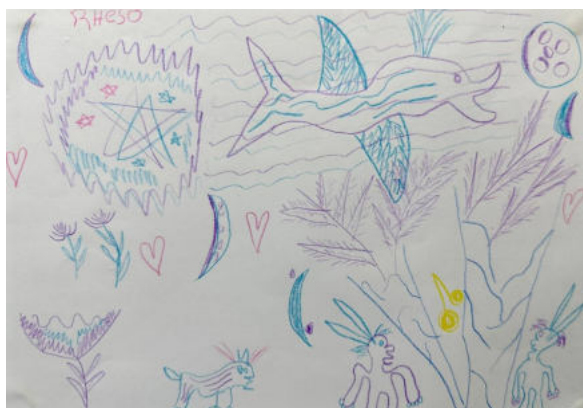
Illustration de Planète Rhésos par Hassan

« Les voyages de Gulliver » est une association dont le but est d'organiser des rencontres littéraires.. LES VOYAGES DE GULLIVER ► Impression offerte par la ville de Carpentras