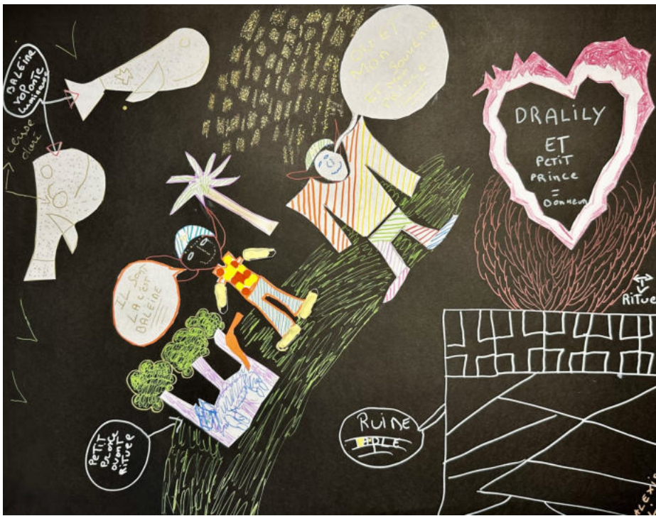
Illustration du conte collectif par Alexis et Vincent

toujours, sans jamais être remplacée. La baleine doit être consentante pour faire son cadeau... Dralily rêve de l'apprivoiser.